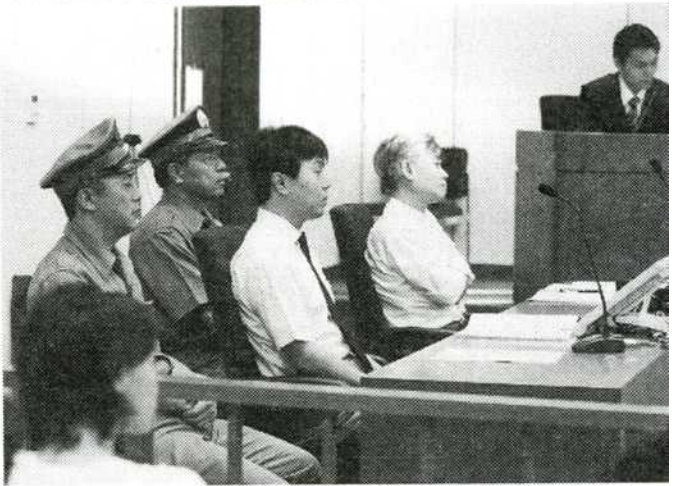
東京地裁で行われた模範裁判の様子。弁護士役(右)と、ネクタイを着けて座る被告人役(左)