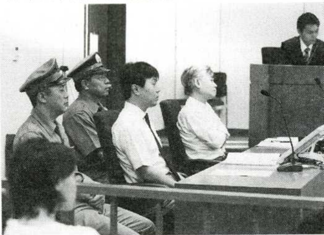
東京地裁で行われた模範裁判の様子。弁護士役(右)と、ネクタイを着けて座る被告人役(左)