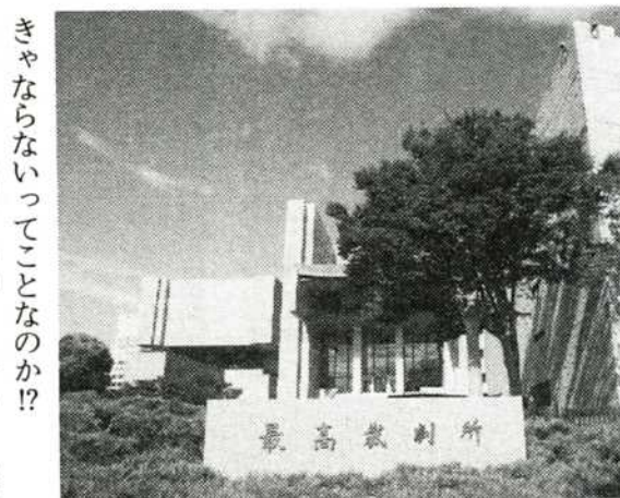
日本の司法を支配する最高裁判所。司法制度の改革よりも、まずはこの改革が先のような…

ということとは、法律に関してはまったくの素人が重罪裁判に参加して、死刑や無期懲役に関わる刑の判断をしな